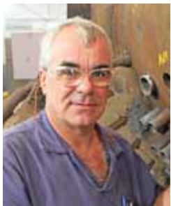
Mingão viu a Thermic evoluir

O s 20 anos de sucesso da Thermic só são possíveis por conta do trabalho e da dedicação de cada colaborador. Ser referência no que faz e ainda inovar apresentando tecnologia de ponta é fruto do dia a dia dos colaboradores. Com muito trabalho, eles fazem a engrenagem funcionar. Conheça abaixo os colaboradores com maistempo de casa.