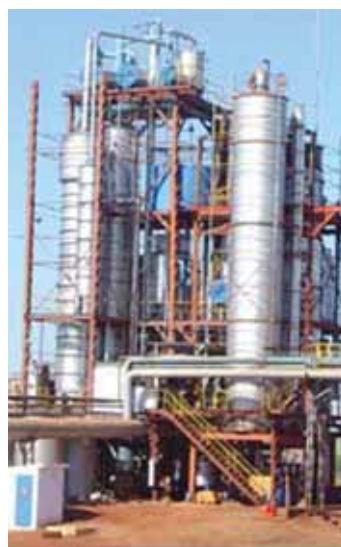
Destilaria Malosso, em Itápolis

Alberconi: Com certeza, a qualidade do serviço prestado é indiscutível. Mas, somado a isso, o atendimento é muito bom também. O acesso aos diretores é fácil e muito rápido.