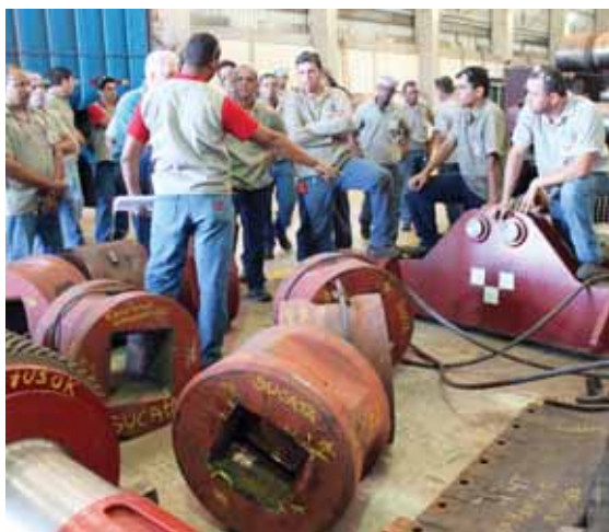
Colaboradores durante a auditoria

E m dezembro, todos os colaboradores da Thermic passaram por uma auditoria de orientação do programa 5S. Trata-se de uma ferramenta de trabalho que visa sistematizar o processo produtivo por meio de planejamento, organização e limpeza. O resultado é a produtividade, segurança, clima organizacional, motivação dos funcionários e mais competitividade no mercado. ■